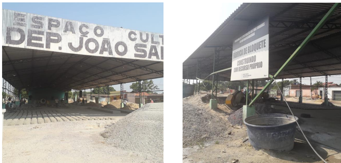
Figura 1 e 2 - Espaço Cultural João Salame

Contudo, nos últimos anos, mais precisamente a 3 anos atrás, o Espaço Cultural foi desativado e atualmente ele se tornou um galpão/fábrica de bloquetes, que desconfigura os objetivos anteriormente propostos para o local, bem como sua paisagem e entorno (figuras 1 e 2).