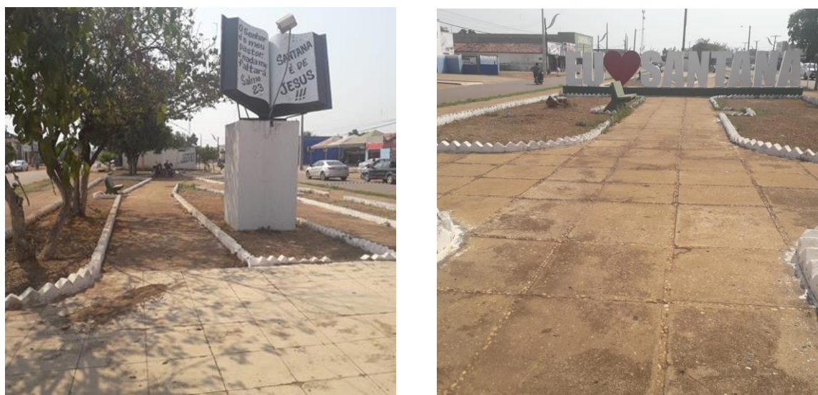
Figuras 3 e 4 – Praça da Bíblia.